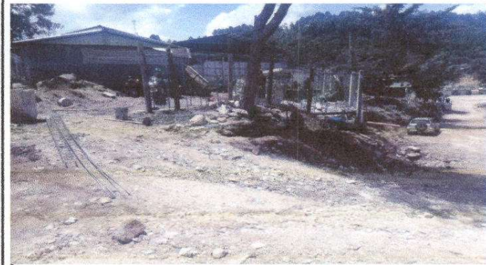
Portón en mal estado, malla rota y columnas de madera deterioradas.