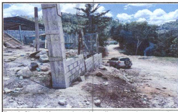
Foto 6: Circulación en mal estado, malla rota y columnas quebradas.

Observación: Si es necesario se pueden agregar hojas adicionales y actualizar el número de hojas.