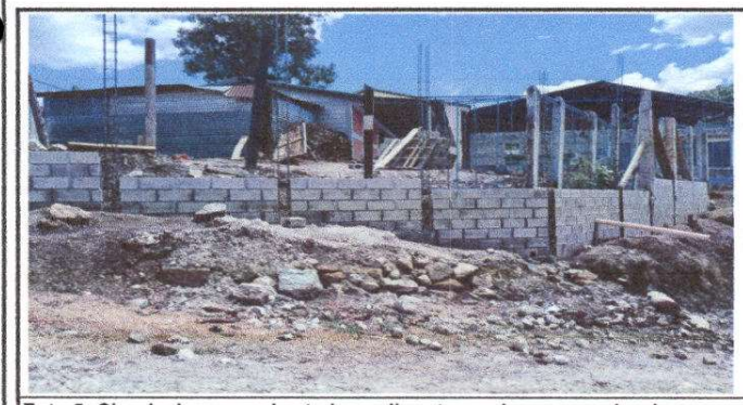
Foto 5: Circulación en mal estado, malla rota y columnas quebradas